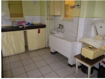
Huidige kleed- /badkamer