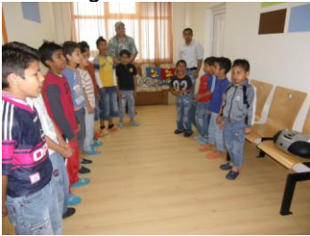
Nieuwe speelkamer aug. 2009.

Bij mijn aankomst werd ik, zoals gewoonlijk, door 15 schattige jongetjes met Bulgaarse liederen welkom geheten. Hún dankbetoon voor de renovatie van hun afdeling vorig jaar zomer.