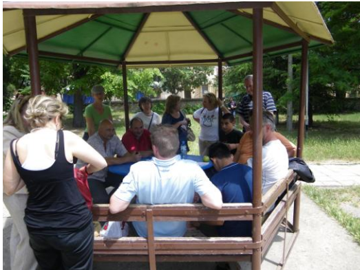
Onze groep juni 2009.