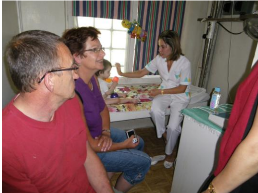
Onze sponsors fysio Pleven.

De kinderen die deze behandelingen ondergaan hebben allen zwakke beenspieren en kunnen dankzij deze apparatuur en oefeningen gaan lopen.