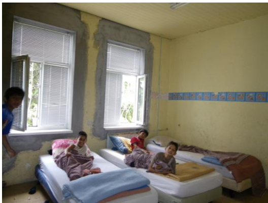
Stara Zagorra: Jongensslaapkamer.

U kunt deze actie steunen o.v.v. renovatie Stara Zagorra.