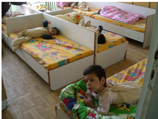
Nieuwe hoeslakens en dekbedovertrekken in vrolijke kleuren.

Inmiddels zijn alle hoeslakentjes en dekbedovertrekken die de stichting bij haar vorig bezoek had besteld, door ons naaiatelier afgeleverd. Agnes heeft dit gecontroleerd en foto's gemaakt.