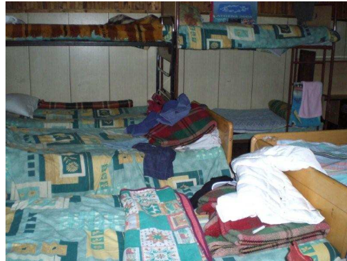
Slaapzaal van de jongens in Razliv