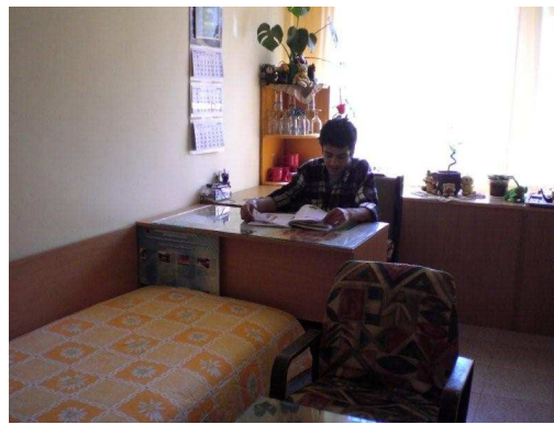
De prachtig gerenoveerde kamers, met meubilair, gordijnen, beddengoed en spreien.

Voor één jongenskamer met nog vijf oude bedden en matrassen was geen geld meer. De kosten van € 500,= hebben wij tijdens onze reis aan de NGO afgegeven voor nieuwe aanschaf.