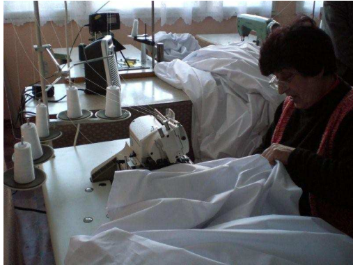
Naaiatelier in Rebarkovo

Continueren met deze lessen voor de toekomst van de meisjes. Lokmachine is door de stichting betaald € 600,=