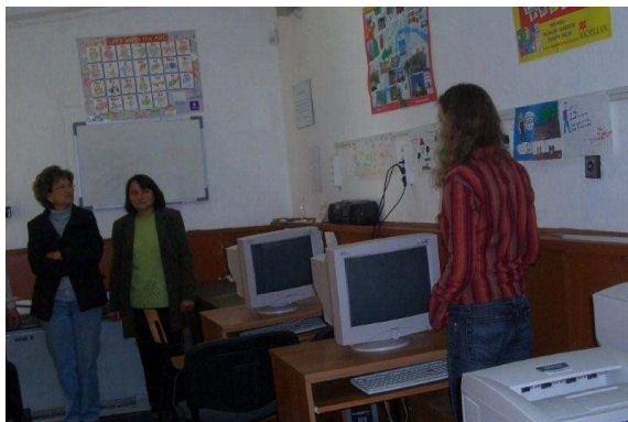
Oude computerruimte in Razliv

Conclusie: Computerlessen zijn inmiddels door de stichting aan de NGO betaald. Voor de opknapbeurt van de computerruimte krijgen wij nog een offerte. (wij zoeken sponsors)