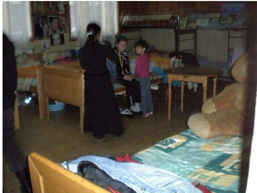
Slaapzaal van de meisjes in Razliv

Het gebouw is zeer oud (1918). De slaapvertrekken en ontvangsthul/huiskamer zijn heel armoedig. De kinderen slapen met z'n veertien in één vertrek.